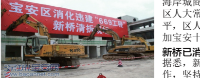
(宝安区消化违建“669工程”新桥新桥)

滨海元素作为凸显沙井比较优势和核心竞争力所在，通过国际交往做靓的文章，打响沙井知名度和影响力；要保持“大观园”、“大宅门”、千年古镇的底蕴、品质、味道、内涵，铭记沙井的历史沉淀、厚德载物、博大精深，大手笔发展沙井；要掌握“深圳质量、品质宝安”的核心理念，做任何事情要秉承国际水准、国内领先，以先进理念来规划设计，精打细算搞好建设。