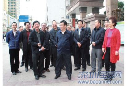
(区领导到沙井街道开展重大工程实地调研)

一季度已拆违24.149万平米 全区排名第2 全新“双十”项目出炉 总投资140.7亿元